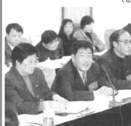
参加东营市第三次党代会的代表们分组讨论审议报告,并结合各自的实际情况,畅谈加快东营发展的大计。