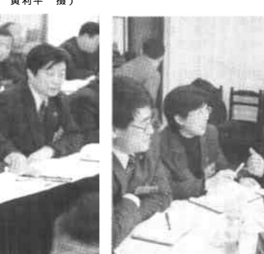
参加东营市第三次党代会的代表们分组讨论审议报告,并结合各自的实际情况,畅谈加快东营发展的大计。

解读“六个必须” 省和全国的表彰就是很好的证明。东营经济之所以能实现高速增长健康发展的关键,是有一个好的稳定环境。 ——必须切实加强和改进党的建设,为经济社会发展提供有力保证。代表们畅谈道,没有各级党组织的领导核心作用和广大共产党员的先锋模范作用,就不可能有改革开放和现代化建设的顺利进行。这些年,市委坚持党要管党、从严治党的方针,全面加强党的思想、组织和作风建设,涌现出一大批先进党组织和模范共产党员。在东营的发展过程中,有这样为中流砥柱,有这样多的奋发有为者,实现跨越式发展又有何愁呢?! ……经验是集体智慧的结晶。随着实践的发展和认识的深化,这些经验将会得到不断的丰富和发展。因为,实践总是要突破不合时宜的框框,为自己的发展开辟道路,并在新的征程上,创造出既有所继承又富有鲜明时代特色的经验,这样才能辉煌久远! ——必须正确处理改革、发展、稳定的关系,努力保持社会政治稳定。代表们在讨论中说,市委始终把抓稳定看得非常重要,在改革的力度、发展的速度和社会可承受程度的把握上,妥善调整各方面的利益关系,表现出了高超的领导艺术和驾驭能力。东营的稳定工作受到